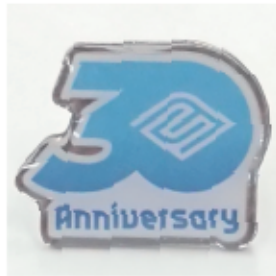
印刷エポバッジ (オフセット印刷) ニッケルメッキ (銀色)