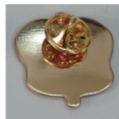
裏面蝶タック ニッケルメッキ