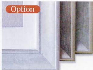
Option 追加高級フレーム/1種 3色/ゴールド・シルバー・グリーン フレームページ参照